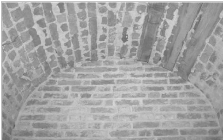
Fot. 8. Zamek w Darłowie – sklepienie murowane „na wycisk” z zachowanymi częściowo deskami opartymi na murach